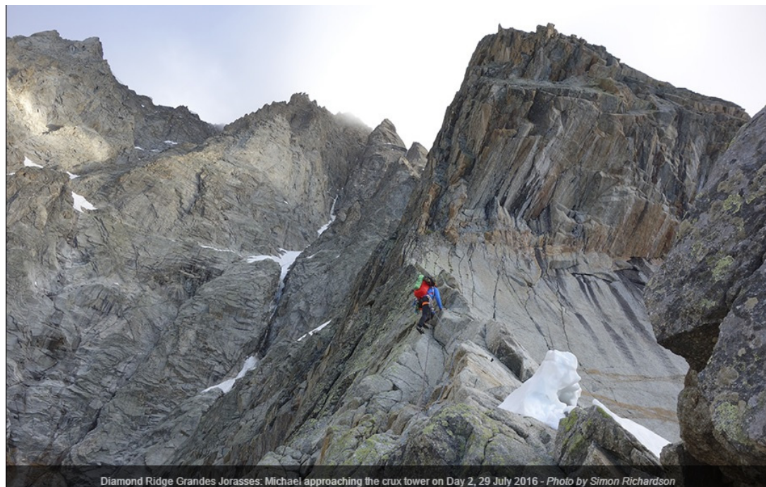
Diamond Ridge Grandes Jorasses: Michael approaching the crux tower on Day 2, 29 July 2016

Мы вышли из Pra Sec (1635m) в Валь Ферре в 05:30 28 июля, и достигли подножия маршрута (2600m) в 09:00. Мы сделали наш первый бивуак на 3250m в 19:00, а вторая ночевка была на 3900m в 22:00 29 июля, на вершине Second Tronchey Tower. Мы добрались до вершины 4208 м в 12:00 30 июля, и вернулись в хижину Bocalatte на 2803 м в 17:00 30 июля. Ключом была крутая башня чуть выше первой ночевки на второй день. Ее прошли с несколькими точками, но легко может пройдена свободно по F6a. Мы использовали еще одну точку выше на второй день, иначе сложность была бы F5c.